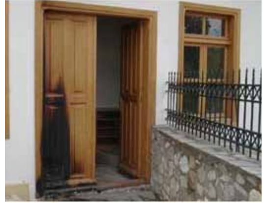
Okçular Camii yeni ve eski saldırıdan iki kare.

Batı Trakya'da idari anlamda gerçekleşen insan haklarının yanı sıra kutsal mekânlara ve şahıslara yönelik sözlü ve fiili saldırılar da sıkça kaydedilmektedir. Aşağıda, son zamanlarda yaşanmış olan bu türden saldırıların ayrıntıları rapor edilmektedir. Saldırıların niteliği göz önüne alındığında hem tarihsel hem de güncel sebeplerinin 50